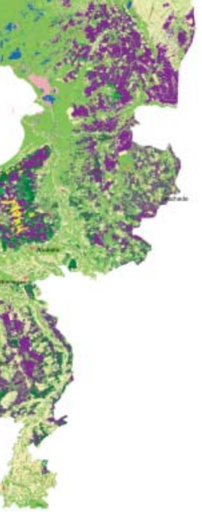
De kaart van Nederland, rond 1900. De verstedelijking in beeld gebracht. Het rood van de versterking is 107 jaar later overal opgerukt.

schaal. De grote Bosatlas is in de eerste plaats bedoeld als een bundeling van lesstof. Alles goed om te weten, dat zeker. Al zullen de vaders en moeders van de pubers van nu het meeste al weer glorieus zijn vergeten. Je moet het leren, want het staat in de Bos! Droog is die lesstof al lang niet meer. Economische banden, kernenergie, de Amsterdamse wijken verdeeld naar dichtheid, afkomst en inkomen: bladeren maar. De leerling van nu moet dat zelf opzoeken. Lekker actueel is dat op de kaarten van de Balkan de provincie Kosovo al op de kaart apart staat ingekleurd van Servië. In die regio gaat het snel en oude en recente kaarten proberen dat duidelijk te maken. De historie en de etnische verschillen: ze staan er in. Zodat ook de doorsnee Kaaskop een beetje wegwijs kan worden in zo'n broeinest. Een beetje leraar kan hier leuke proefwerkjes van maken. Pak die atlas en zoek maar op. De inflatie in Europa, de schuldenlast, arbeids-ethos, telefoonbezit of uitgaven voor de gezondheidszorg? Het staat er in. Soms dwingt de gewenning van zoveel generaties – de eerste Bosatlas verscheen in 1877 – de makers tot concessies. In vaders tijd werd het grote land dat Europa en Azië besloeg lekker overzichtelijk op een kaart geplakt. Dat was namelijk de