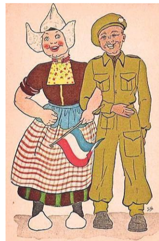
Een Ansichtkaart uit de zomer van 1945, inhakend op de liefde tussen Nederlandse meisjes en geallieerde bevrijders.